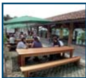
3 Cascina del Parco Agricolo Milano sud