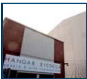
2 Hangar della Bicocca