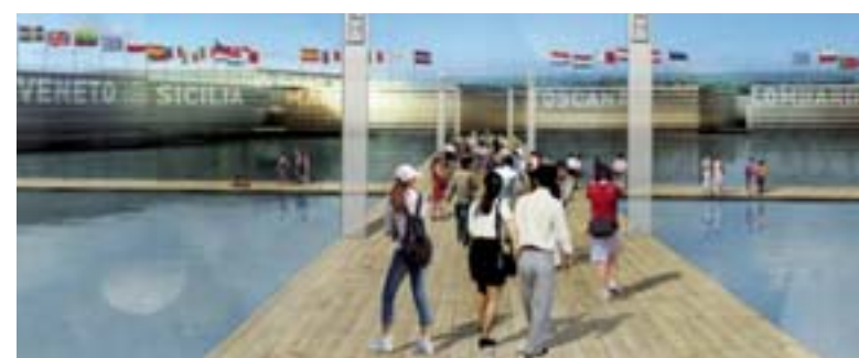
5 Il progetto Il rendering di come verranno realizzate gli edifici di Expo 2015 nell'area vicino alla Fiera di Rho-Pero