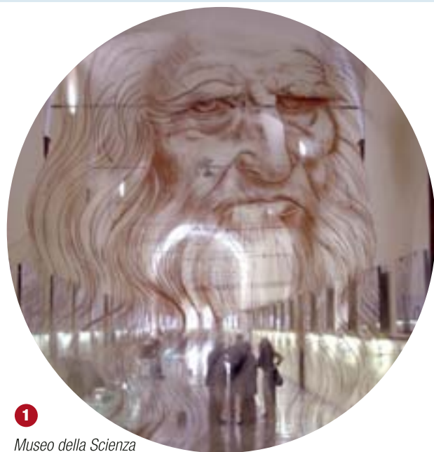
1 Museo della Scienza e Tecnologia

Architetti, designer e intellettuali propongono "un'Expo diffusa", capace cioè di sfruttare gli spazi già esistenti a Milano, sull'esempio del Salone del mobile