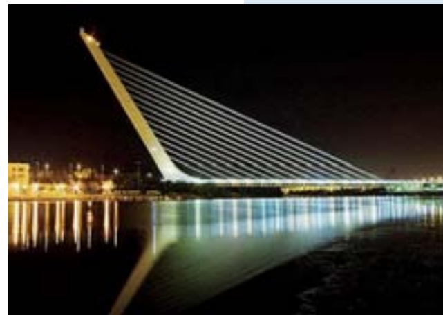
Le luci di Siviglia Il ponte disegnato dall'architetto spagnolo Santiago Calatrava e costruito per l'Expo 1992

Il mega-evento e il rischio flop «Va studiato il caso Siviglia»